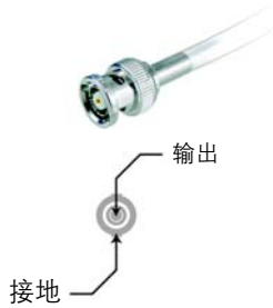
普通 BNC (60 年代初)