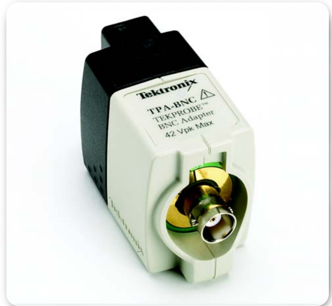
► TPA-BNC TekProbe-BNC Level 2 到 TekVPI 探头接口适配器