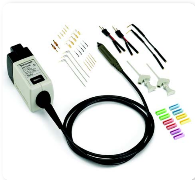
► TAP2500 (一般是 TAP1500)